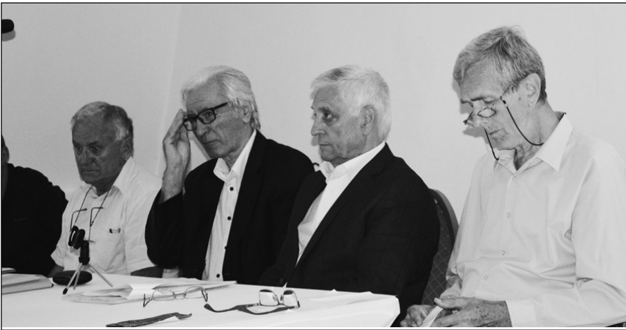
Радно председништво скупа

оправдало своје постојање. Неки резултати то нарочито потврђују", истакао је Туманов.