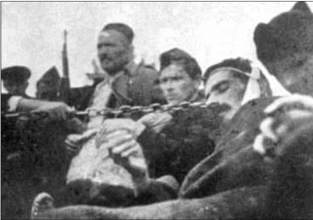
Највећа брига поклоњена је рањеницима

на у неколико међусобно тактички неповезаних група и изложена непрекидним нападима противника, а посебно авијације. Уз све то владала је тотална глад, јело се што је ко стигао - траву, буково лишће и коњско месо. Вишедневни ноћни покрети, неспавање, глад и јуриши потпуно су исцрпели физичку снагу бораца.