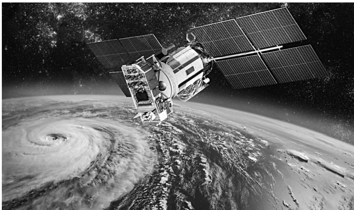
Сателити су веома моћна средства за извиђање бојишта у реалном времену

сам десет. Испод— никаквог кретања. Молим информацију о црвеним миговима.“