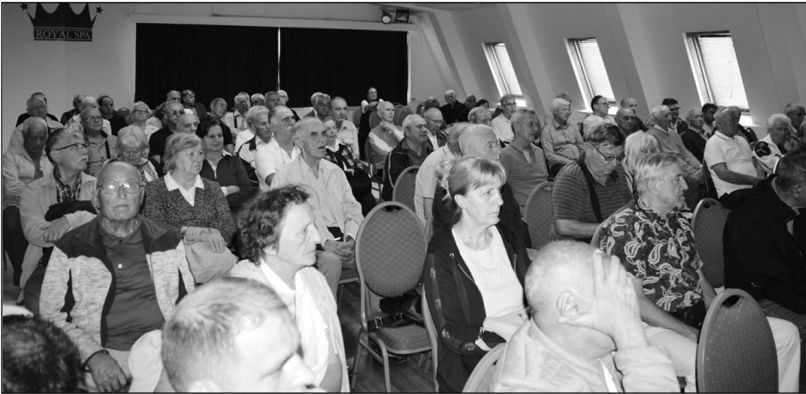
Први пут је Скупштина заседала изван Н. Београда