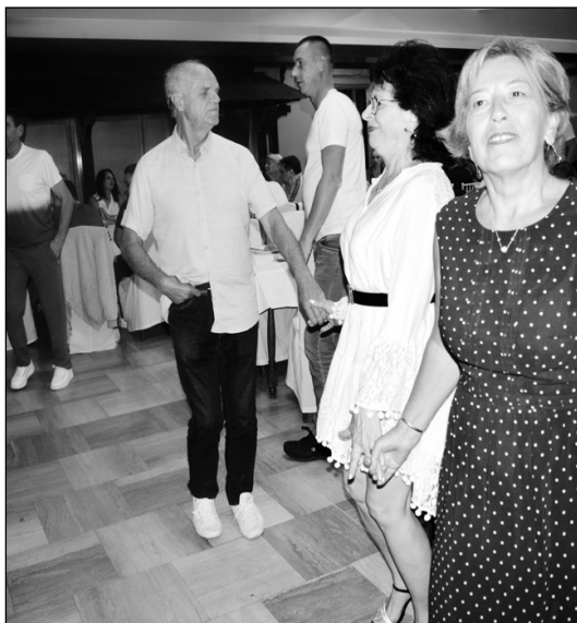
Кола су веома омиљена

Вече је било испуњено песмом и игром. Било је и валцера и танга, а пре свега више пута вило се велико народно коло. Мало ко му је могао да одоли.