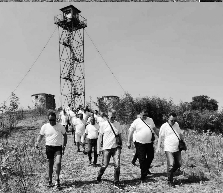
Као некад граничним стазама