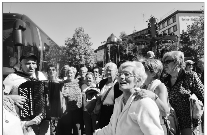
Песма о Крагујевцу у центру тог града

З аједничко дружење војних пензионера из Србије и Републике Српске снажна је прича која ангажује чланове да упознају један од крајева Србије и Републике Српске, уз ангажовање најбољих водича и уз посете најважнијим локалитетима и музејима. Да, на тим местима се учи историја, обновљају се знања која су излетници сами стекли или су их понели из школе. Када сунце зађе, наступа време културно-уметничких активности. Буде то распевана и разиграна дружина. Приликом досадашњих дружења у Бањалуци су формирана женска и мушка певачка група, којима су се придружили и поједини чланови из Новог Сада и Пожаревца.