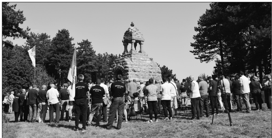
На Мачковом камену се окупио велики број грађана