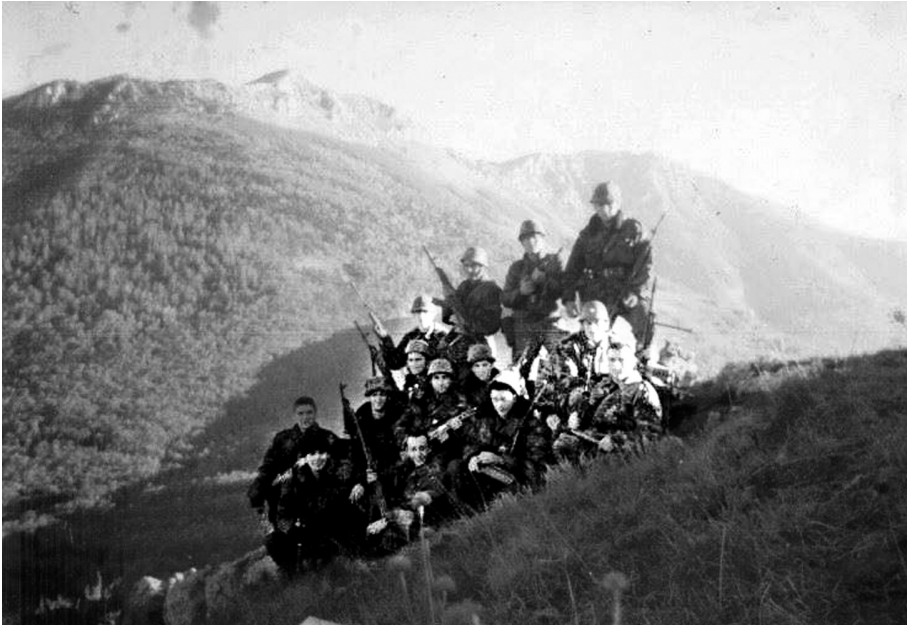
Јунаци Битке на Паштрику

водом и наставила да непрекидно бомбардује јединице.