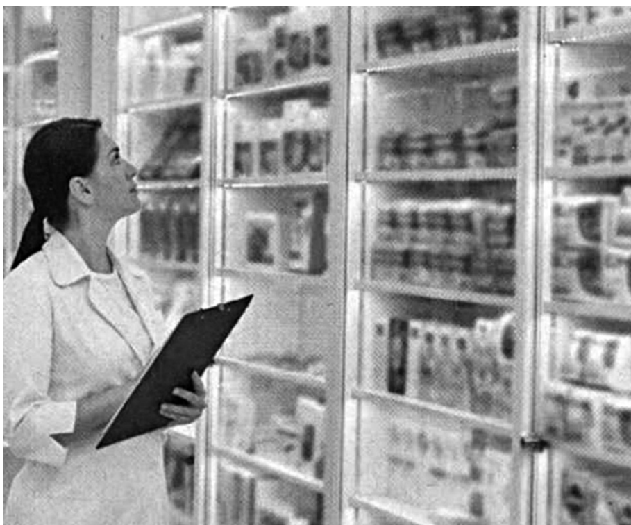
Дозу лекова може да пропише само лекар

Зато што су лек за шећерну болест неке особе куповале и пиле да би смршале, фармацеути у апотекама сада траже рецепт и за лекове који су годинама били у слободној продаји