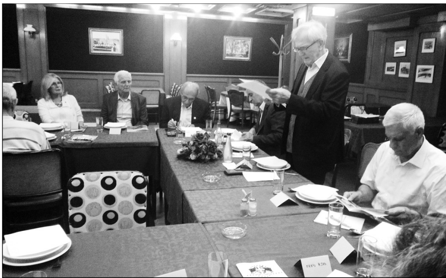
Део учесника свечаног скупа

Општинска организација УВПС Земун убраја се у оне које без већих осцилација испуњавају своје програмске и статутарне обавезе. Њихов рад би могао да се дефинише народном изреком „Тија вода брег рони“.