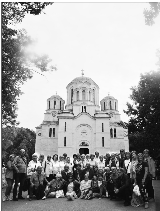
Испред Маузолеја Карађорђевића на Опленцу