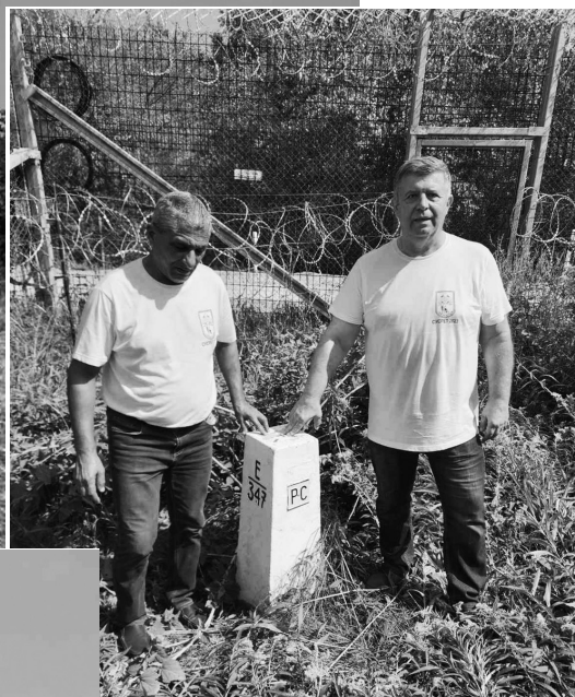
Крај граничног камена 347