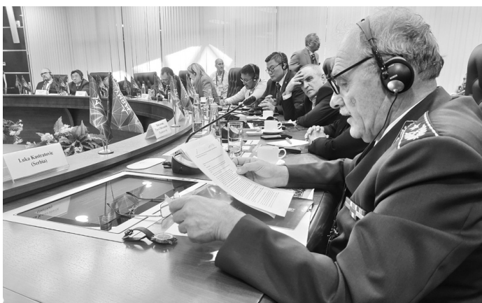
Учесници скупа су с пажњом пропратили говор генерала Кастратовића