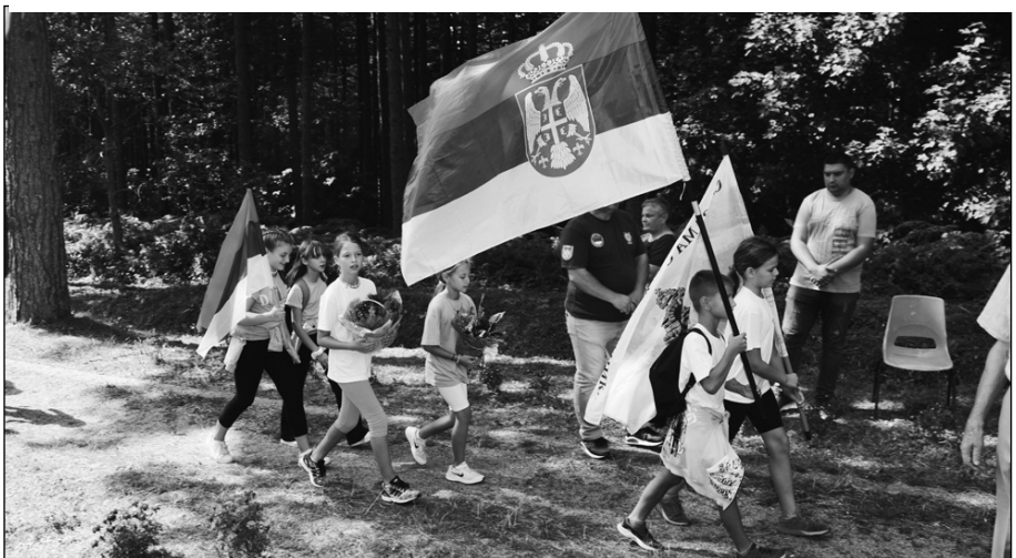
Бацци су маршевали до места чувене битке