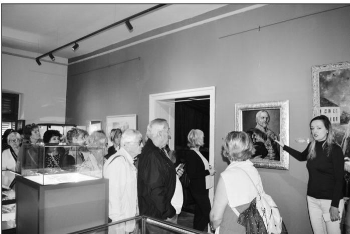
У Музеју посвећеном Обреновићима