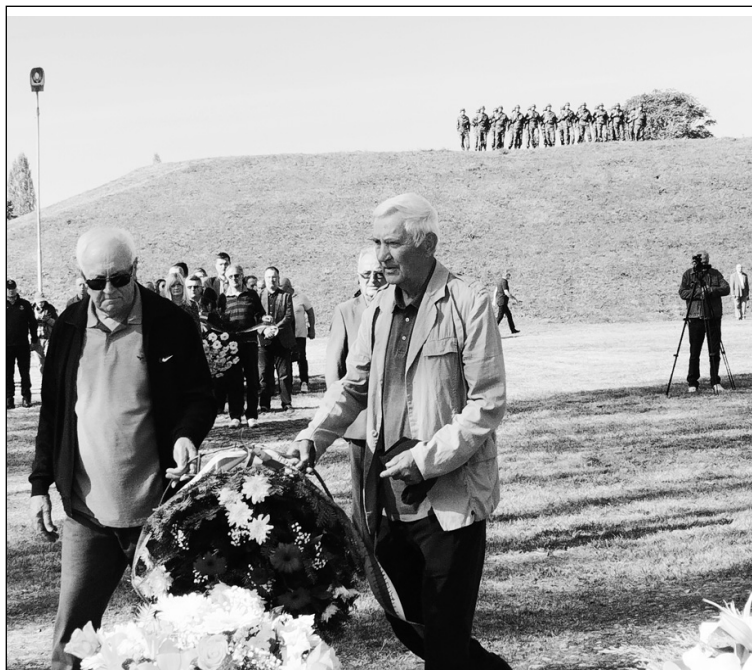
Сећање на стрељане Краљевчане 1941. године