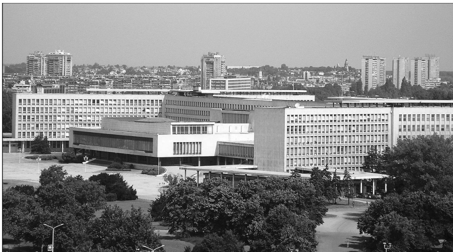
Нови Београд је препознатљив по палати „Србија“

Данас Општинска организација УВПС Нови Београд има 3.269 чланова добро организованих у осам месних организација од 220 најмање до 630 највеће са изабраним руководством, општинским одбором и канцеларијом која је дневно на располагању својим члановима и свим корисницима војне пензије на Новом Београду.