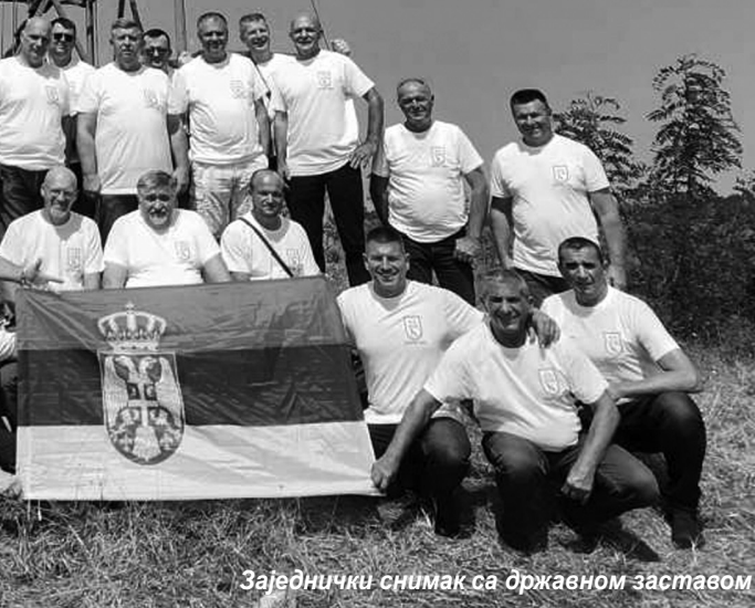
Заједнички снимак са државном заставом

Граничари су некада имали свој дан, 15. август, који је укинут заједно са граничарском службом, али се многи од њих окупљају сваке године да се подсети времена када су непоколебљиво стајали на бранику отаџбине. Овом приликом прошли су патролном стазом тик уз границу и обишли највишу тачку у Бачкој, код граничног камена 315 и најсевернију тачку Србије код граничног камена 347, напуштене карауле и осматрачнице, препуштене зубу времена.