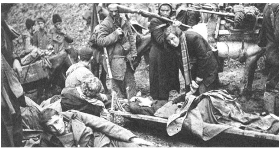
Партизани у предању између две борбе