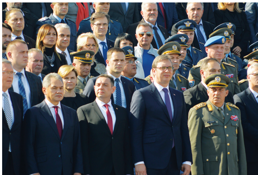
На свечаној трибини су били највиши државни и војни функционери са председником Александром Вучићем на челу