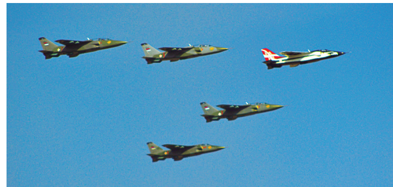
„Орлови“ су измамили аплауз гледалаца

На гробљу ослободилаца нашег главног града и на споменик страдалим руским вели-