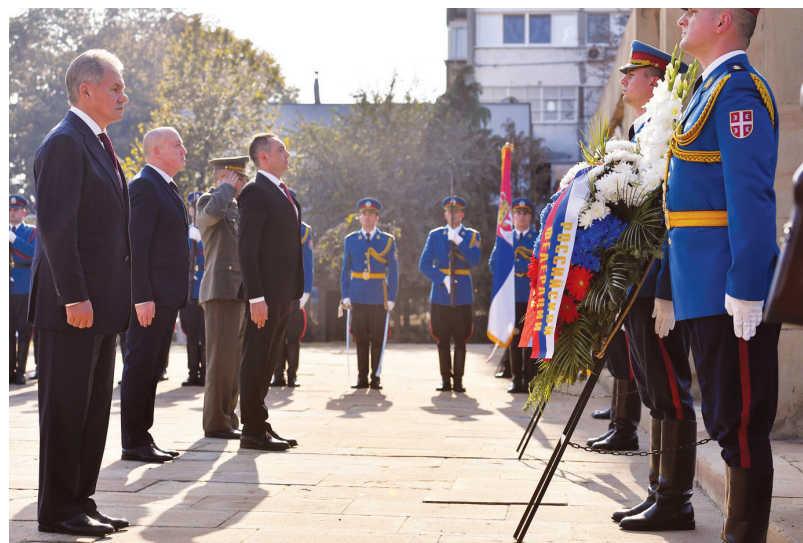
На гробљу ослободилаца Београда венце су положили министри одбране Сергеј Шојгу и Александар Вучић