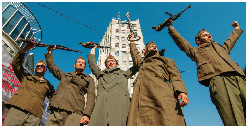
Перформанс како је ослобођен Београд пре 73 године