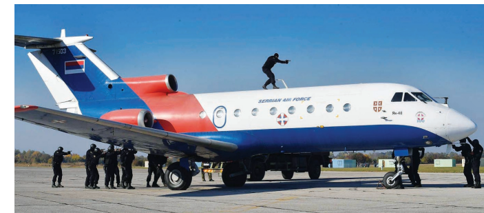
Решавање талачке ситуације у отетом авиону