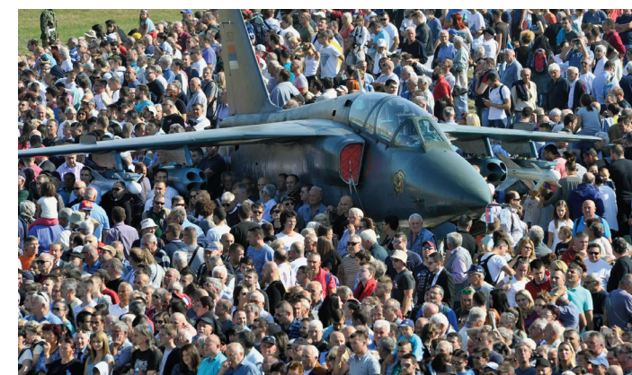
Технички збор је привукао пажњу многих посетилаца