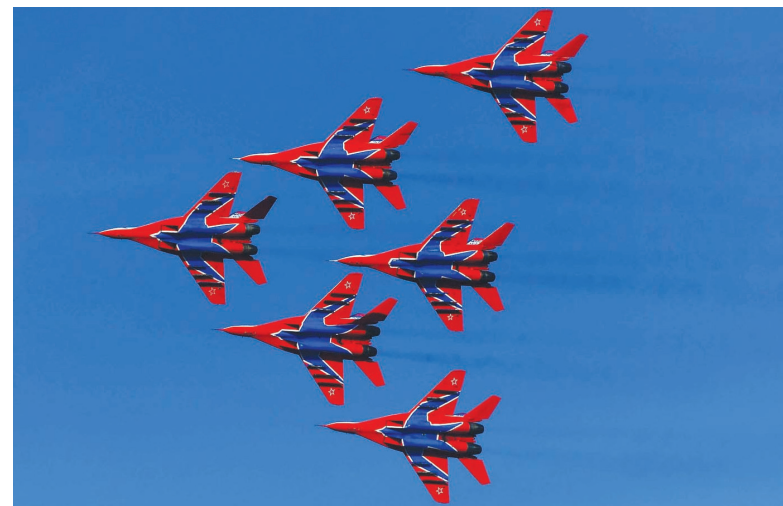
Наступ акро-групе „Чиж“

канима на Авали државне делегације Србије и Русије, борци НОР-а и многобројних удружења положили су венце.