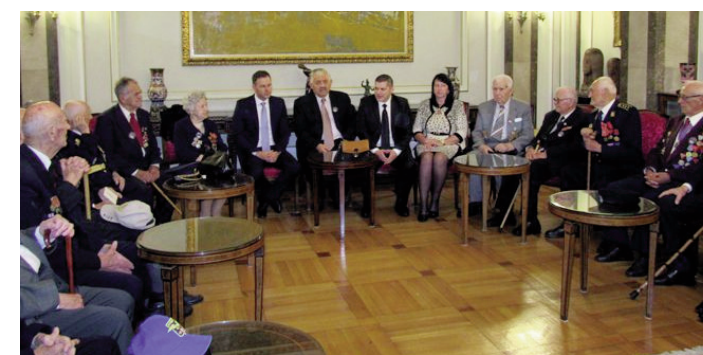
Пријем бораца у Скупштини града