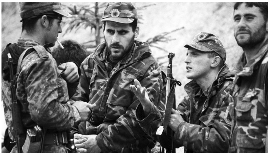
Терористи ОВКду упорно покушавали да расеку наше снаге

У 0.05 часова извршен је истовремени удар са 20 пројектила по рејону Горожупских бачила, по већ савременом селу Планаје и по лажном Терзијском мосту на реци Ереник у рејону села Бистражин, источно од Ђаковице. Том приликом погођена је позадинска јединица за снабдевање, при чему су погинула два, а рањено 35 војника. Већина их је била контузована, али је било и оних који су задобили унутрашње повреде од силне експлозије.