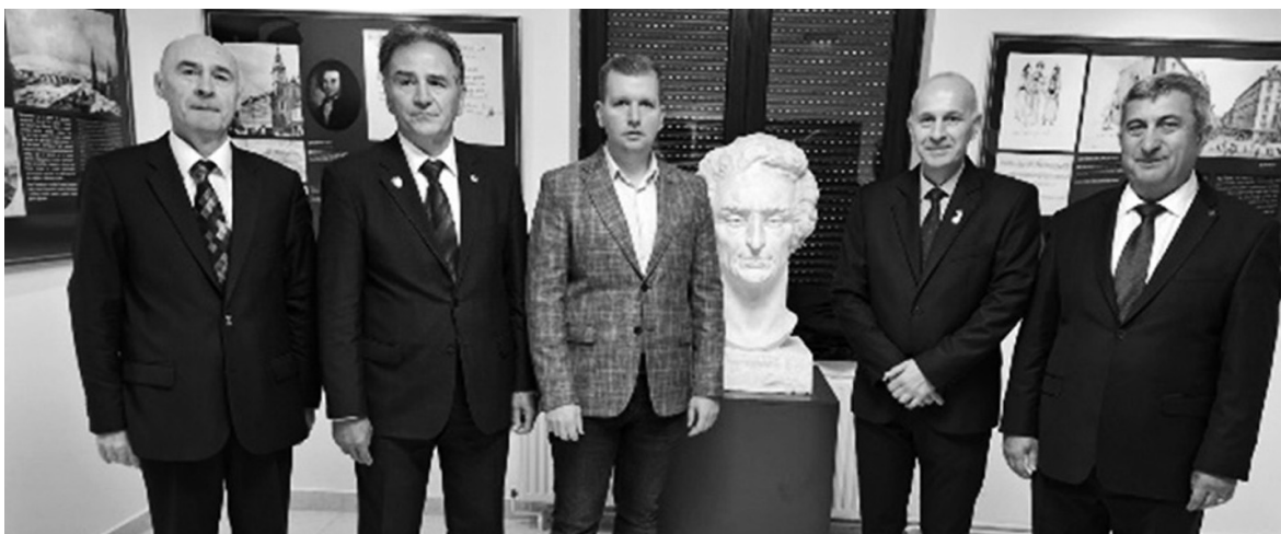
Са представницима резервних и пензионисаних старешина