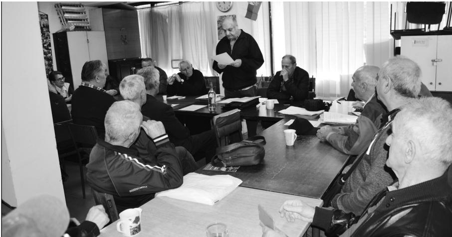
Војни пензионери Чукарице с пажњом су пратили излагање свог председника

Свечана седница је била прилика да се поброје сви значајнији успеси, али и да се одреде наредни задаци војних пензионера у тој општини