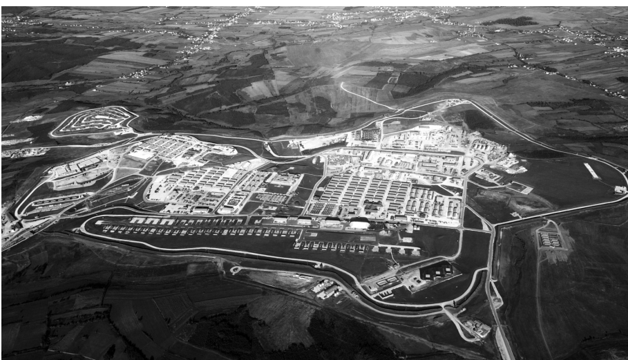
Поглед на базу НАТО-а Бондстил

принципи међународних односа, да активно брани своја права и легитимне интересе, посебно независност, суверенитет и територијални интегритет и да не узмиче под било каквим притисцима или уценама. То је наш европски, слободарски и национални идентитет који је свима познат и који представља извор снаге и врло широке међународне подршке. У нашем је вековном идентитету да смо увек били отворени, и остајемо отворени, за сарадњу са сваким другим који нас истински уважава, али да никада не изневерамо осведочене пријатеље, савезнике и стратешке партнере. И по томе се Србија разликује од многих других. То има своју цену, Србија то боље познаје од многих других.