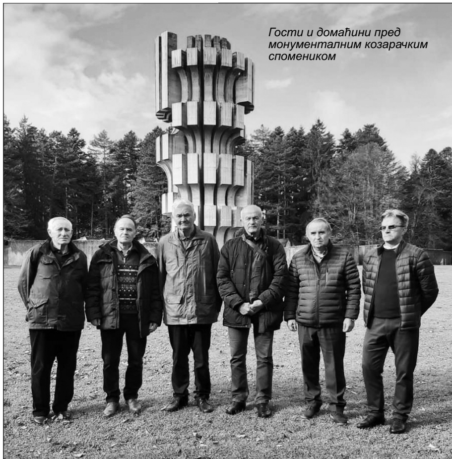
Гости и домаћини пред монументалним козарачким спомеником

Другог дана посете 15. новембра, председник Удружења војних пензионера у Републици Српској, организо-