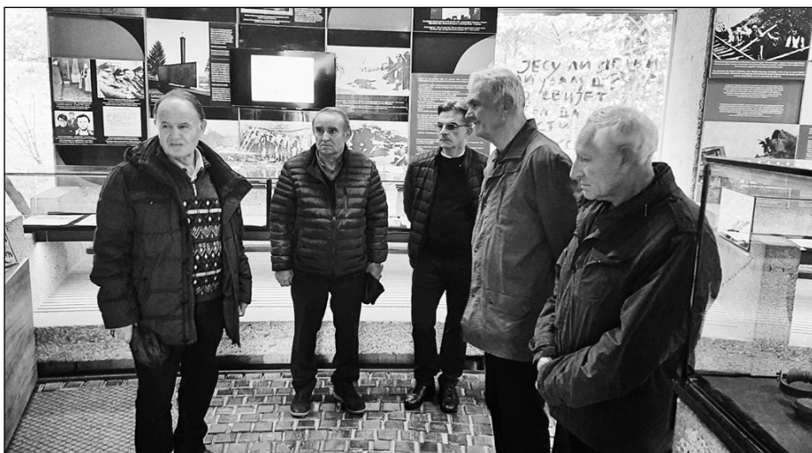
У музеју Козарачке епопеје

Организација војних пензионера Републике Српске, као придружени колективни члан УВПС, представља удружење које успешно остварује прокламоване циљеве. Због тога, а и међусобне блискости, сусрети руководства на највишем нивоу доприносе даљем развоју односа.