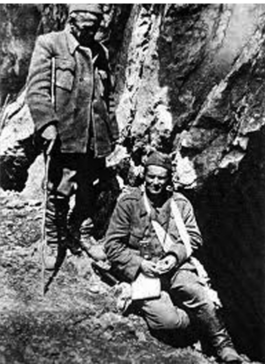
Иван Рибар и рањени Јосип Броз Тито на Сутјесци