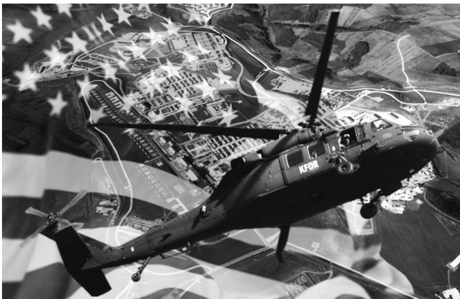
Снаге КФОР-а последњих година не испуњавају обавезе када је реч о безбедности неалбанског живља