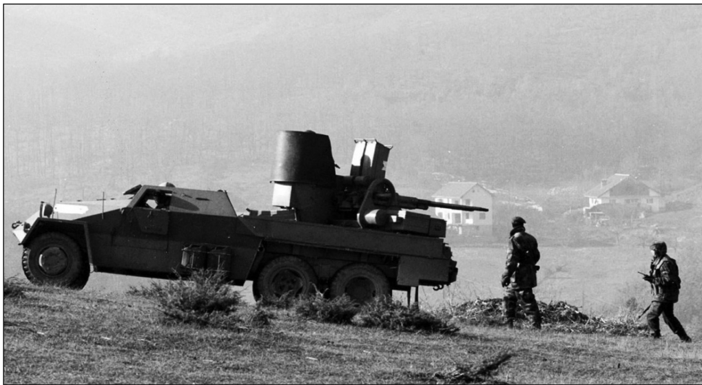
Припадници наше војске на положају

Пошто истрага није завршена, у овом тренутку не придајем посебан значај инциденту. Претпостављам да су граничари Македоније залутали у упали у наше минско поље. Наредујем