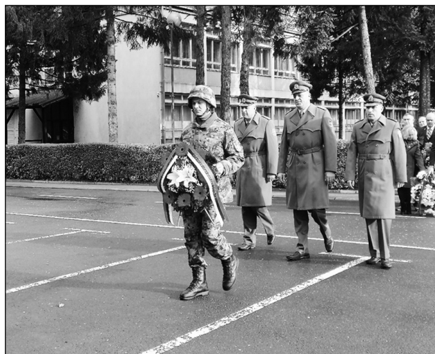
Полагање венца поводом Дана примирја у Првом светском рату