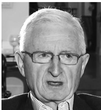
ПИШЕ Живадин Јовановић

Протеклих месеци амерички и британски „независни“ аналитичари развијају „теорију“ о наводном „другом руском фронту у Европи – на Балкану“, приписујући Русији одговорност за све што у ствари провоцирају Приштина, Сарајево и још понеко из региона, по познатом шаблону замењених адресата. Колико је у свему томе апсурда, говори и то што данас, док теку прогон, застрашивање и тзв. тихо етничко чишћење Срба са Косова и