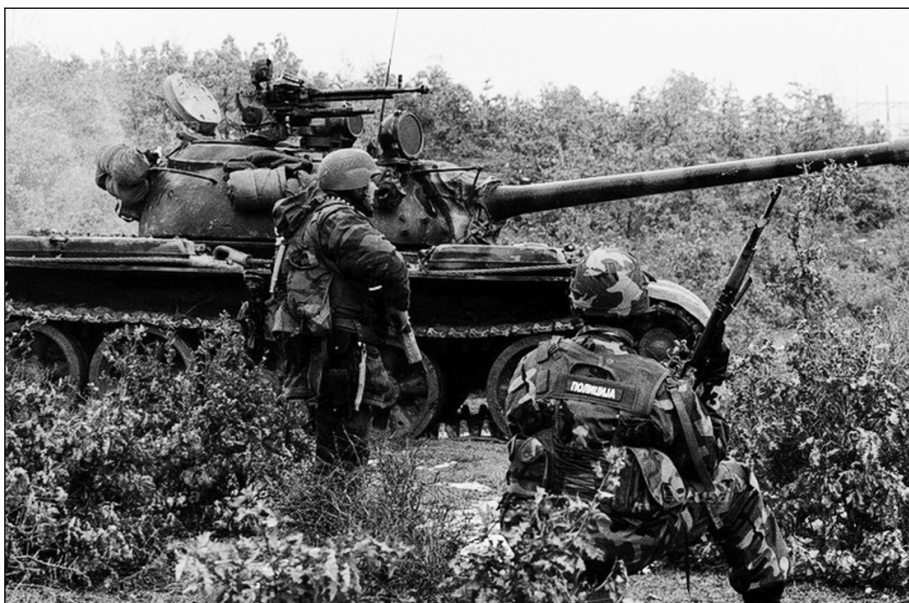
Посебне снаге полиције на задатку

Из размишљања ме је пренуо резак звук сирене која је огласила „ваздушну опасност”. Било је 10.00 часова. Сви присутни су погледали у мене. Лазаревић је прекинуо излагање. Знају да сам последњих дана игнорисао сигнале „ваздушне опасности” и нисам напуштао објекат. Овога пута то