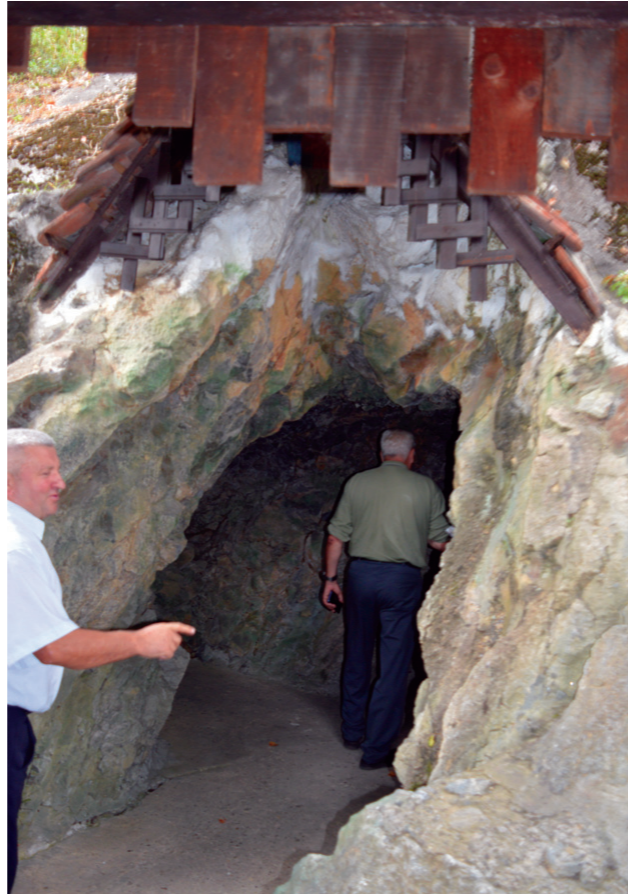
Улаз у једну од неколико пећина