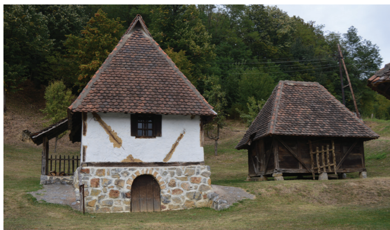
Све је као у нека давна времена