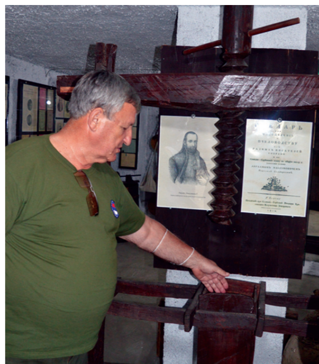
Машина за штампање разних материјала