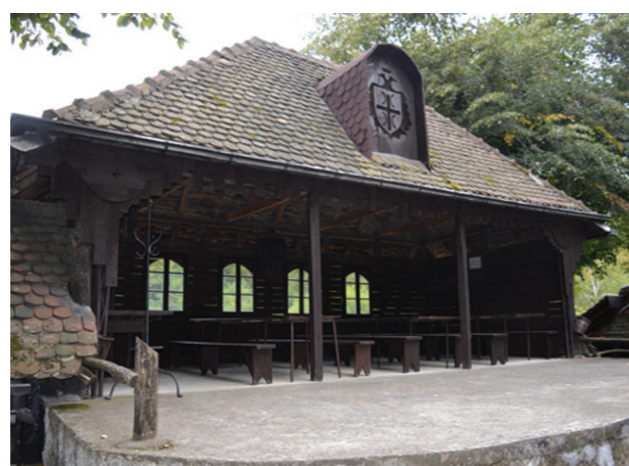
Место за окупљање