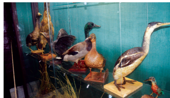
Птице само што не полете