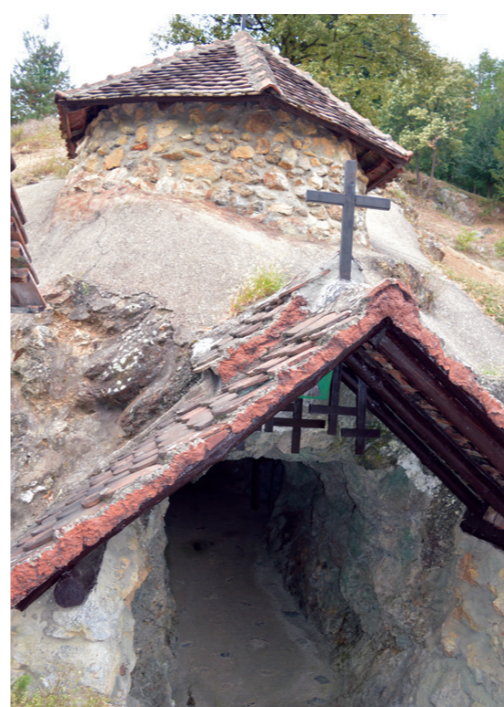
Овде је уложен велики труд