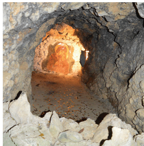
Капела Свете Петке