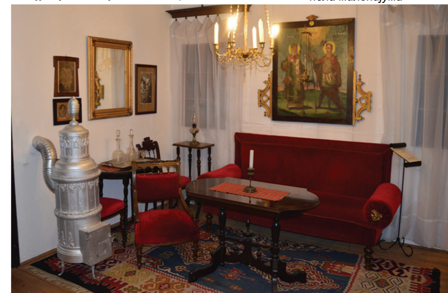
Соба каквих је било пре 200 година