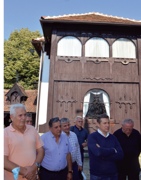
Комплекс походе различите групе, међу којима и војни пензионери