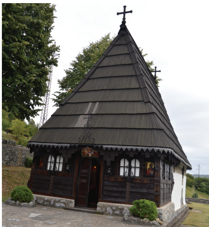
Црква постоји од 12 века