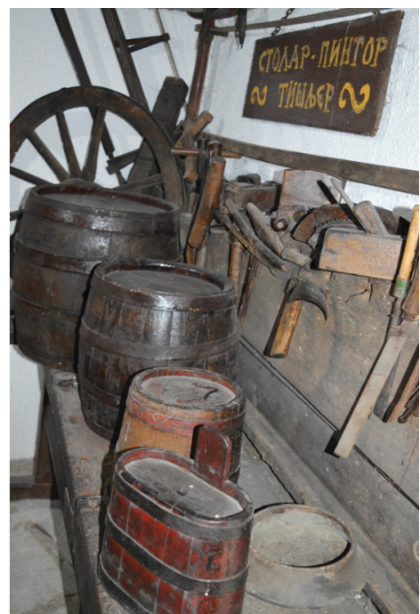
Предмети и алати старих заната