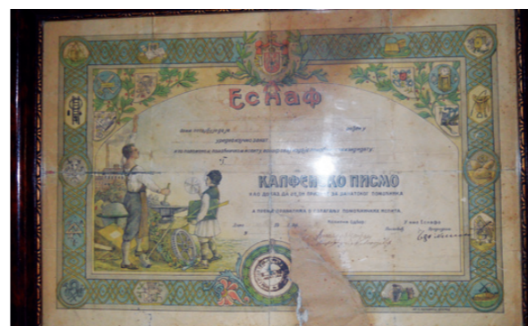
До калфског писма се није лако долазило