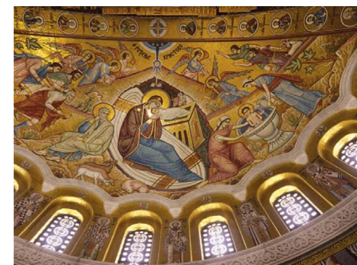
Игра светлости и боја