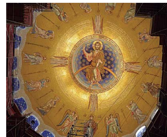
Мозаик унутар храма јединствен је у свету