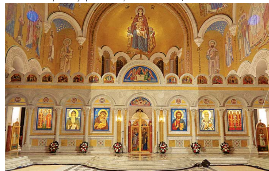
Камени иконастас подсећа на личност кнеза, то су копије рељефа са кнежеве приправе у манастиру Хиландару