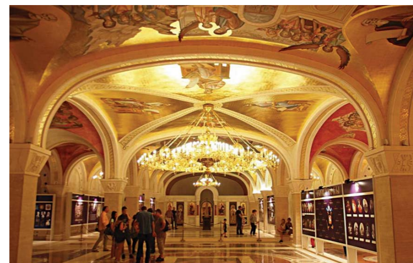
У Крипти су приказани страдали из Јасеновца и Јадовна