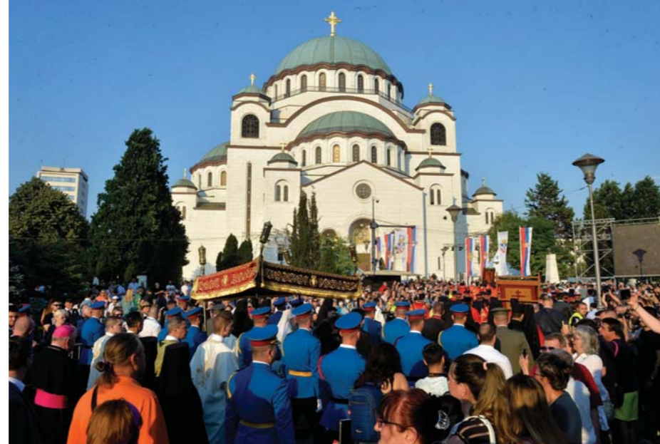
О Спасовдану се окупи велики број грађана