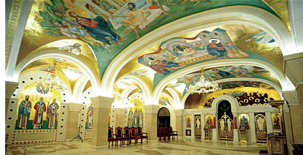
Крипта је и место за културне догађаје