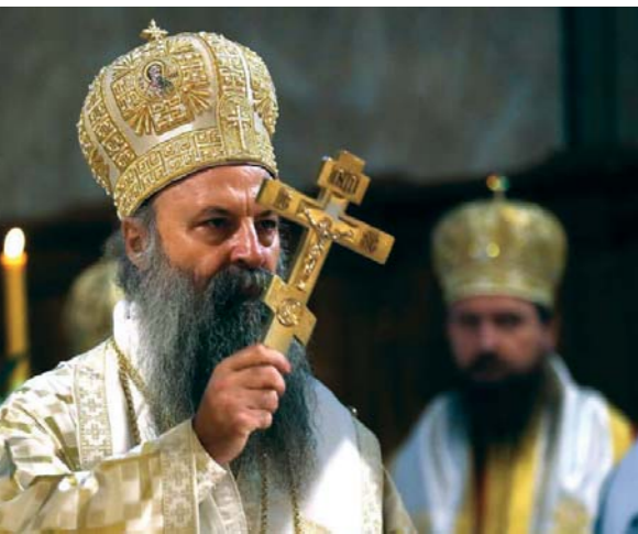
О великим празницима литургију предводи патријарх српски господин Порфирије