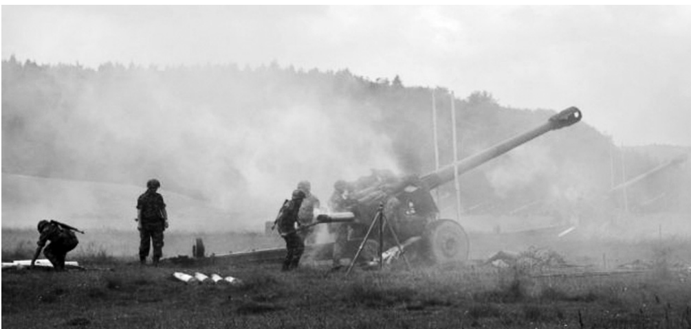
Дејсо наше артиљерије