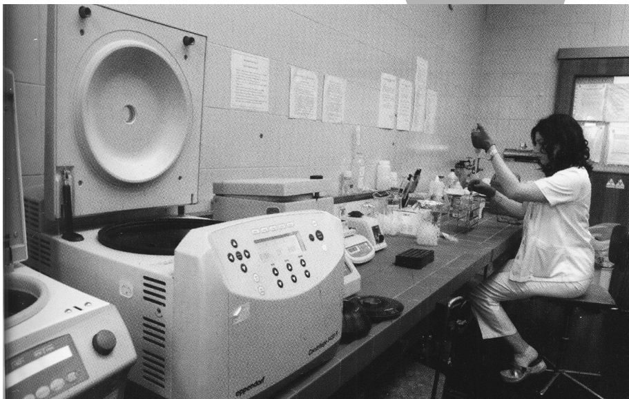
Војно здравство је опремљено савременим средствима дијагностике

ца функција у Министарству одбране се-стрински кадар је подмлађен и обезбеђена је добра попуна. То је значајно јер свуда недостаје кадар, људи завршавају школу и одлазе у иностранство.