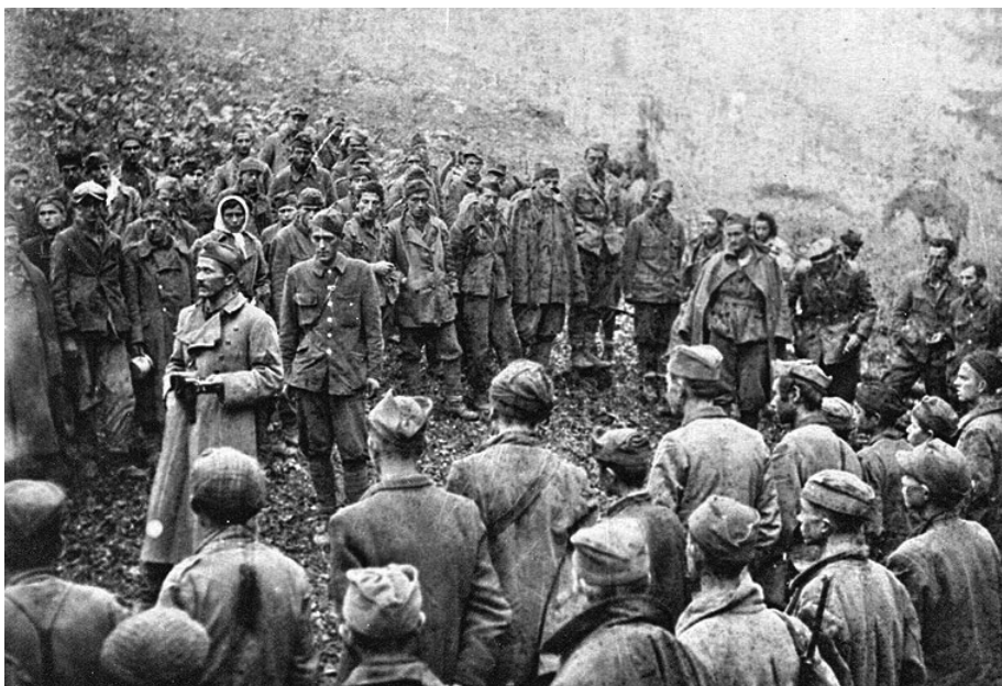
Положај Главне оперативне групе био је веома неповољан и једини спас представљао је пробој из обруча

вљена ситуација. Противник је био одбачен према Трврху уз осетне губитке, чиме је отклоњена највећа опасност за угрожене прелазе на Тари код Узлупа и Шћепанпоља. У току 22. и 23. маја и даље су напредовале све три бригаде према Фочи преко Тро врха и Златног Бора, али нису заузеле ове објекте. Ови објекти су више пута прелазили у руке једне и друге стране, али су их Немци ипак заузели.