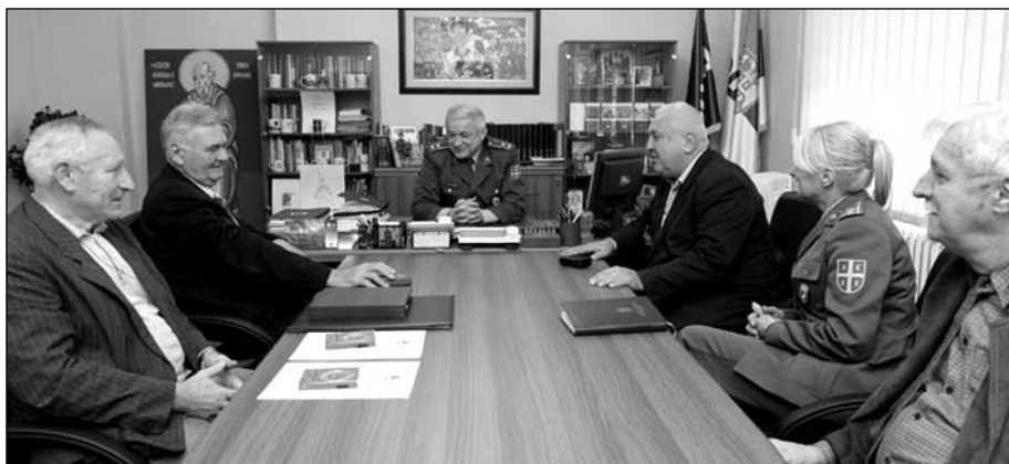
Медија центар „Одбрана“ пружа значајну помоћ УВПЈ

На седници Извршног одбора УПВЛПЈ, 16. марта 1993, полазећи од чињенице да