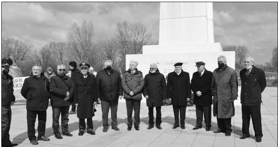
Вође делегација после полагања венаца на Споменик „Вечна ватра“

Средства за решавање стамбених потреба КВП обезбеђују се Одлуком Скупштине Фонда за СОВО: од 2,5 одсто средстава на нето пензије: дела намењеног за друштвени стандард КВП; добијених продајом станова; добијених давањем у закуп станова; од ануитета по зајмовима; амортизације станова; и средстава стечених на други начин.