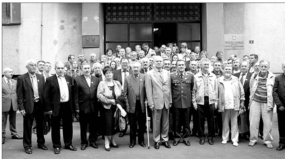
Четири деценије 21. класе ВВА

Удружење је патриотска организација чији чланови интересе отаџбине, њене слободе и