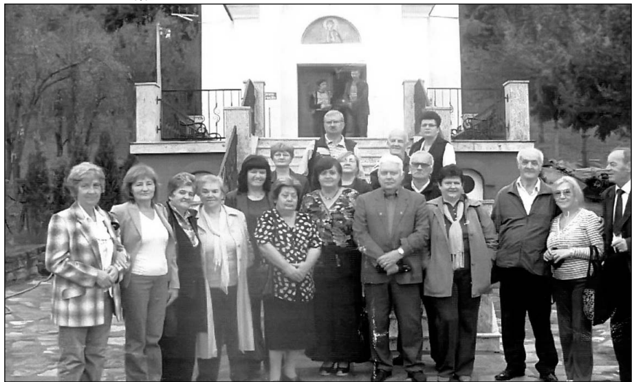
Крагујевчани на „Златној берби“

- уставна одредба да је одбрана државе право и дужност сваког грађанина нашла је место у дефинисању Удружења да је оно, између осталог, и патриотска организација; у Програму је истакнуто да је одбрана земље приоритетан задатак Удружења као дела одбрамбених снага друштва, јер су читав активни радни век војни пензионери били на том задатку и у огромном броју су лојални држави у којој живи, а тако ће бити и убудуће; уосталом, то се