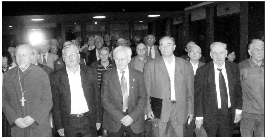
Са обележавања двадесетогодишњице ГО УВП Ниша

Задаци Удружења, према Статуту из 1995. године, јесу: помоћ војним пензионерима у остваривању основних права из области пензијског, инвалидског и здравственог осигурања и социјалне заштите; прикупљање мишљења чланова о побољшању материјалног положаја и статуса, и достављање предлога државним органима или самостално решавање; предузимање мера на унапређивању и спровођење пензијског, инвалидског и здравственог осигурања и социјалне заштите; сарадња са органима Фонда социјалног осигурања војних осигураника (Фонд за СОВО), Савезног министарства за одбрану (СМО), Генералштаба Војске Југославије, командама и установама Војске Југославије, Организацијом резервних војних старешина Југославије, и са борачким