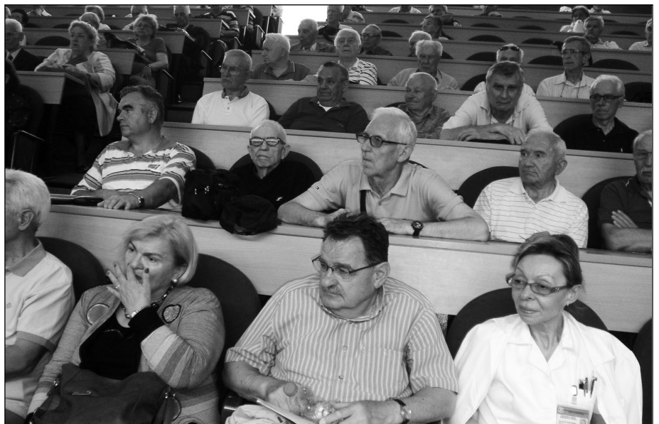
Новобеоградски војни пензионери на једном од скупова

Програмски став да војни пензионери морају бити правовремено, стално, потпуно и квалитетно информисани о свим питањима њиховог статуса, егзистенције и рада Удружења, остварује се успешно. Садашњи систем информисања задовољава потребе, али треба да се остваре и обогати новим садржајима и облицима. То је могуће ослонцем на сопствене снаге уз помоћ Савезног Министарства одбране, Фонда СОВО и Војске Србије и Црне Горе.