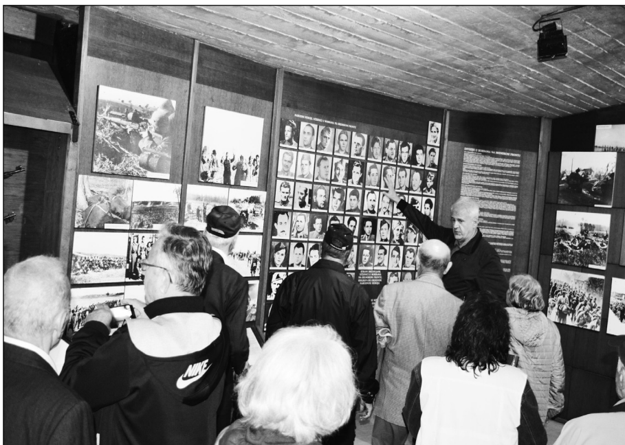
У Музеју Сремског фронта

Према дефиницији Светске здравствене организације, здравље је стање потпуног физичког, менталног и социјалног благостања. Сви ти елементи су код корисника војне пензије нарушени, како због специфичних услова службовања, тако и због старосног доба, а посебно услед настале социјално-економске ситуације у последњој деценији. Корисници војне пензије су у 90 одсто случајева старији од 60 година. У тренутку писања монографије само на територији Србије живи 20.040 корисника војне пензије старијих од 65 година, а од тог броја у Београду 12.248. Из тога произилази да се организација војних пензионера суочава с проблемима здравствене заштите старих особа. Смисао здравствене заштите ста-