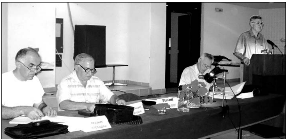
Радно председништво увек има пуно посла

Други стратегијски правац деловања Удружења обухвата напоре, иницијативе, анализе, предлоге, мере, разговоре, посете и апеле упућене органима државе и јавности у вези са материјалним и социјал-