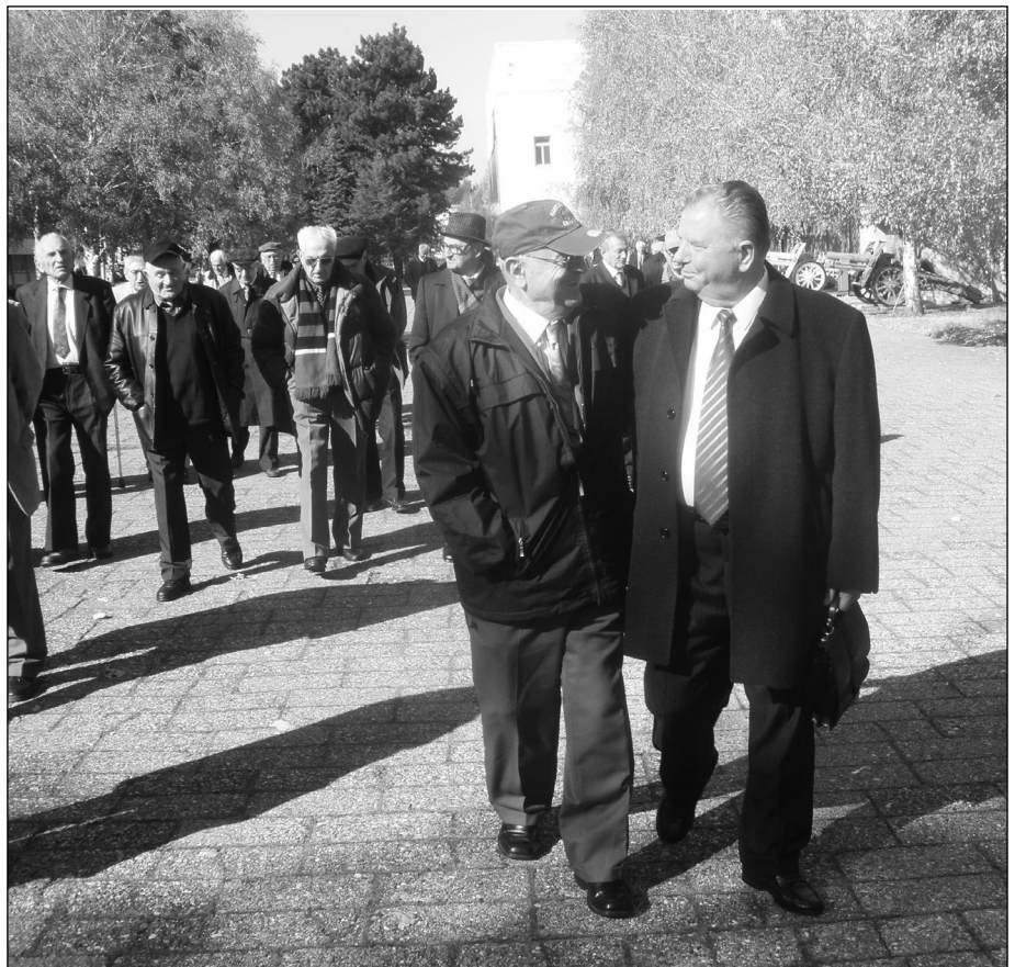
У УВПС се нарочито негује другарство

Дугачак је списак активности Извршног одбора Удружења предузетих ради обезбеђења