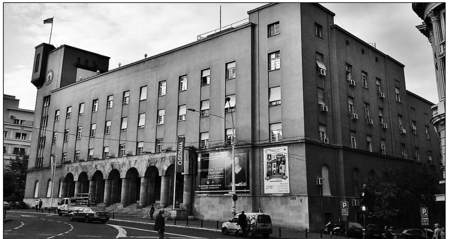
Седиште УВП налази се у Дому војске Србије

За пензионере је то значило укидање стечених и на закону заснованих статусних права из пензијског осигурања, што је било противзаконито. Та мера деловала је апсурдно, јер се на летачки и падобрански додатак стално уплаћивао допринос за социјално осигурање, чак са већом стопом него на остале делове плате. Било је