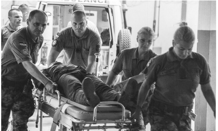
Медицинско особље је на терену, где се припадници ВС обучавају за одбрану земље

-Одувек је војни санитар улагао у кадар. То је можда једна од највећих тековина коју смо наследили од наших претходника. Данас то реализујемо кроз разне облике школовања и усавршавања. Што се тиче школовања у току 2023. планирано је упућивање официра и војних службеника на специјализације како на Медицински факултет ВМА, тако и на Медицински факултет Универзитета у Београду. Слично је и са ужим специјализацијама.