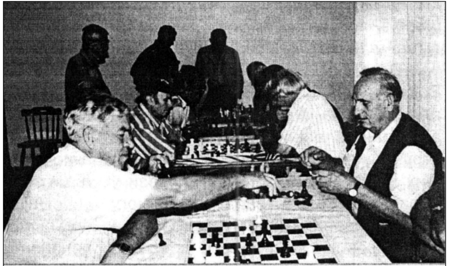
Шах је омиљена игра војних пензионера

Након тих покушаја и исцрпљивања расположних мера, полазећи од статутарне обавезе заштите права својих чланова из области ПИО и закључака Главног одбора, председник Удружења упутио је „Предлог Уставном суду Југославије за оцену уставности и законитости одлука Савезне владе о одређивању коефицијента за утврђивање укупног износа средстава