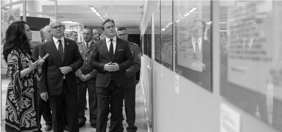
Отварању изложбе присуствовали су високи државни званичници

Говорећи о немачкој ратној пропаганди, Вучевић је истакао да она потпада под такозвану „црну пропаганду“, засновану на лажним претпоставкама, а самим тим и неистинитим закључцима који се из ње изводе