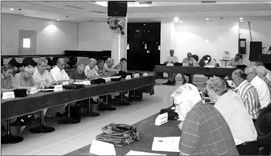
Са једне од седница Главног одбора УВПС