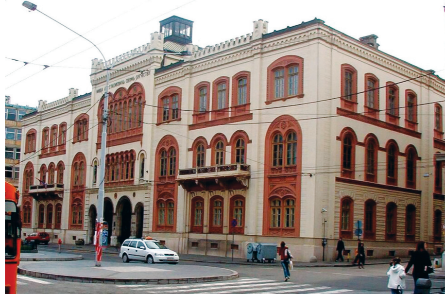
Капетан Мишино здање у којем се налази седиште Београдског универзитета