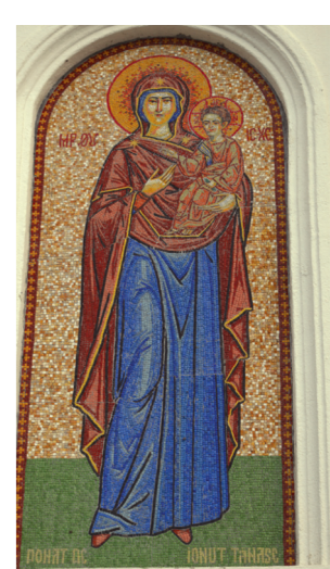
Фреска на спољном зиду цркве