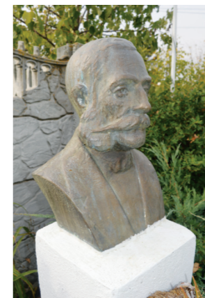
У порти пред црквом мермерна биста великог добротвора