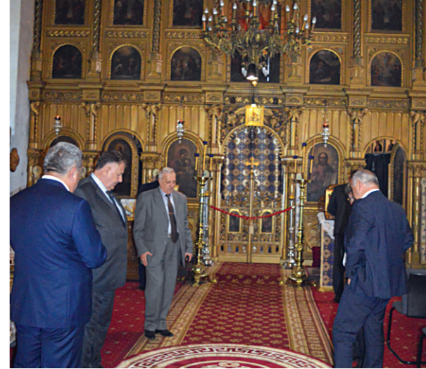
Унутрашњост цркве после реновирања