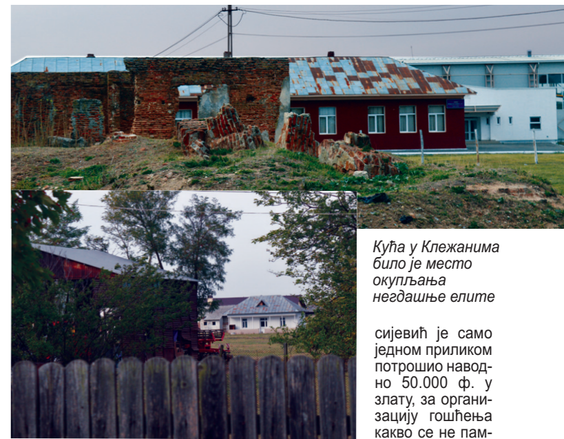
Кућа у Клежанима било је место окупљања негдашње елите

му је обезбеђивало положај једног од најбогатијих људи на Балкану.