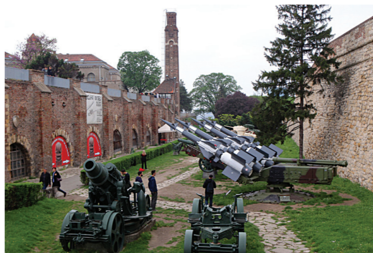
Уз трофејно тешко оружје из два светска рата експонат је и лансир-рампа са које 1999. године је ракетом оборен „невидљиви“ Ф117 А