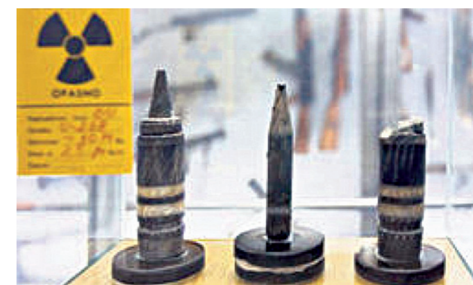
У Војном музеју се чувају и пројектили са осиромашеним уранијумом које је НАТО испалио на простору наше земље

Најзначајнији предмети су заставе XIX века, оружје српске средњовековне војске, богато украшено занатско оружје балканске израде