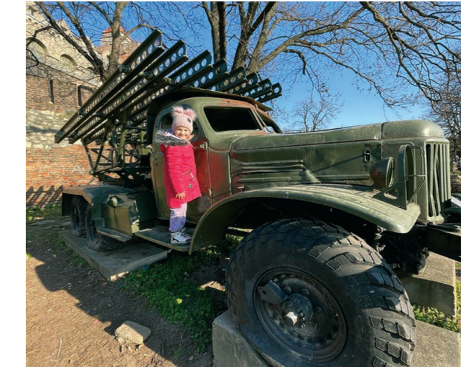
Некада је „Каћуша“ била главно оружје против фашиста

На ушћу Саве у Дунав, на простору тврђаве Калемегдан, који више од два миленијума доминира тим крајем Београда, смештен је Војни музеј, установа система одбране што баштини слободарску традицију Србије. Реч је о институцији која сакупља, проучава и представља различите предмете за војну употребу, а пре свега оружје, униформе, ратне заставе, војна документа и уметничка дела са војном тематиком. Зграда у којем се налази велико богатство наше земље подигнута је 1924. године за потребе Војногеографског института, која је 1956. године уступљена Музеју.