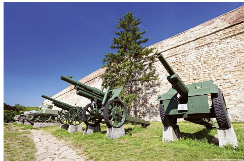
Део експоната смештен је између зидина београдске тврђаве