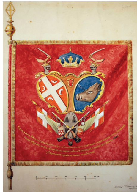
Застава коју је Вожд добио од руског цара