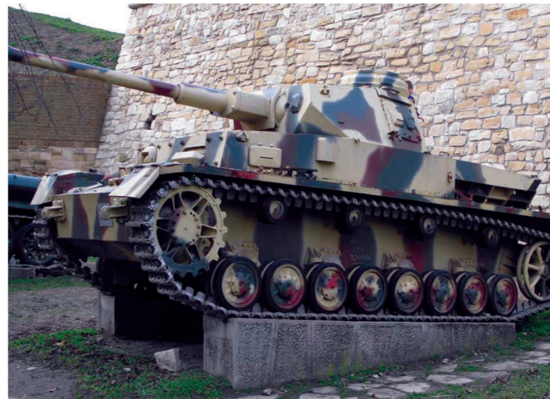
Експонати су у бојама као када су произведени