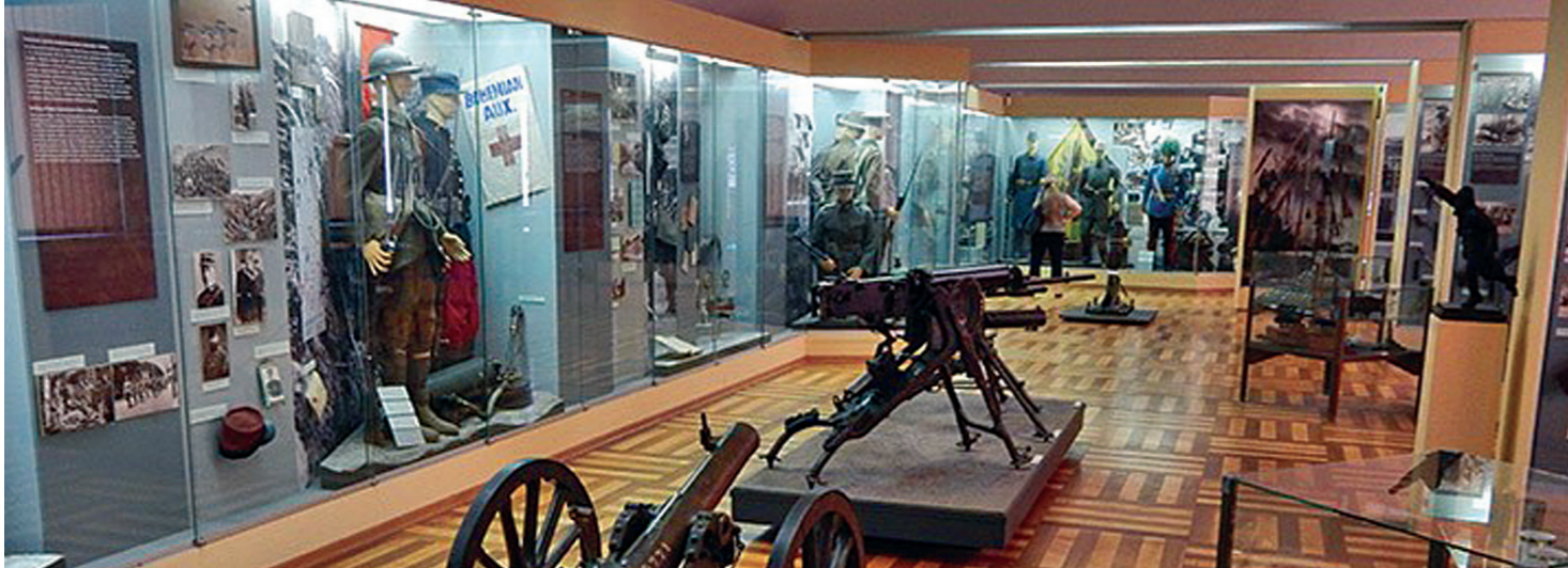
У бројним одајама налазе се на хиљаде докумената и предмета из богате слободарске традиције нашег народа, али и шире