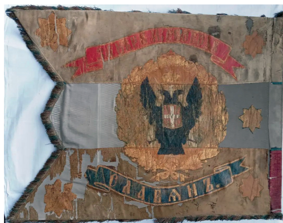
Застава руских добровољаца у српско-турском рату 1876. године

На ушћу Саве у Дунав, на простору тврђаве Калемегдан, који више од два миленијума доминира тим крајем Београда, смештен је Војни музеј, установа система одбране што баштини слободарску традицију Србије. Реч је о институцији која сакупља, проучава и представља различите предмете за војну употребу, а пре свега оружје, униформе, ратне заставе, војна документа и уметничка дела са војном тематиком. Зграда у којем се налази велико богатство наше земље подигнута је 1924. године за потребе Војногеографског института, која је 1956. године уступљена Музеју.