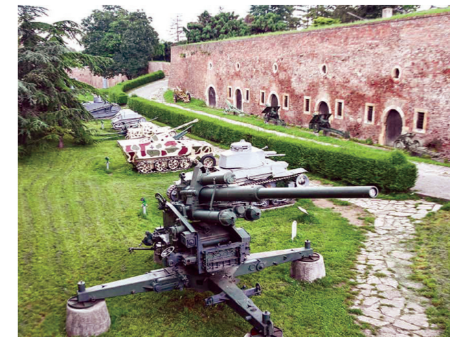
Оружје је из оба светска рата