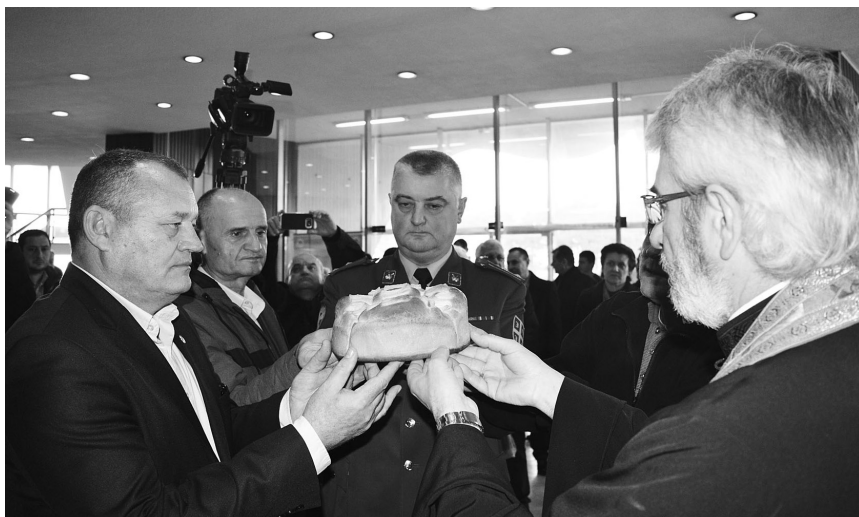
Повратак традицији: пресецање славског колача