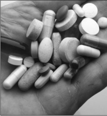
Што је више лекова, то је већа дилема када их узимати