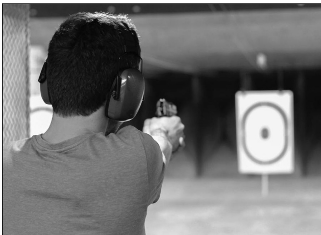
Чак и чланови стрељачких клубова нису ослобођени такси на оружје

Објашњење је просто и логично: војни пензионери су то оружје купили од „Заставе“ још док су били у активној служби или на други начин набавили, желе да га задрже а да се не баве ловом или стрељаштвом. Зашто неког приморавати да се бави ловом ако физички то није у могућности или не жели? Има случајева да власници оружја у позним година физички не могу да се баве ловом и стрељаштвом, а