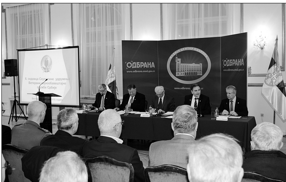
Ветерани војнообавештајне службе се често друже на разноврсним активностима

Ветерани војнообавештајне службе остварили су веома добру сарадњу са удружењима у Србији и реализовали многобројне активности. Поред тога, на основу споразума о сарадњи, у циљу размене искустава о организацији, статусним и другим питањима, у току 2018. године настављена је сарадња са представницима удружења Руске Федерације, Белорусије и Бугарске.