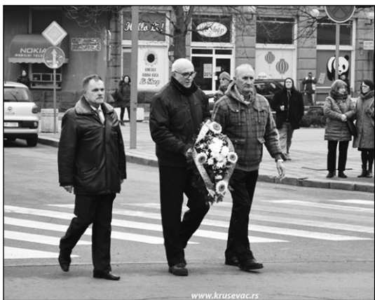
Делегација војних пензионера на полагању вена-