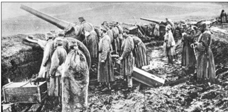
Значајну улогу у пробоју Солунског фронта имала је артиљерија српске војске