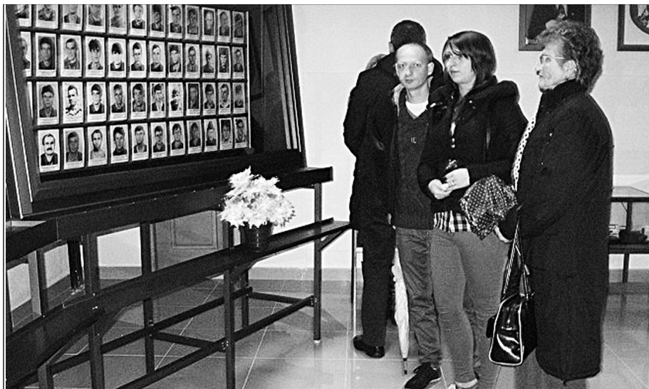
У Спомен-соби 125. моторизоване бригаде

Традиционалним окупљањем и дружењем припадници некадашњег Центра војнотехничких школа КоВ ЈНА „Генерал армије Иван Гошњак“ негују успомене на драматична збивања из 1991. године