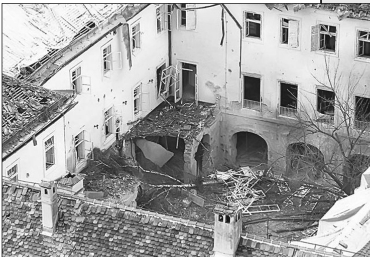
Бански двори 1991. године