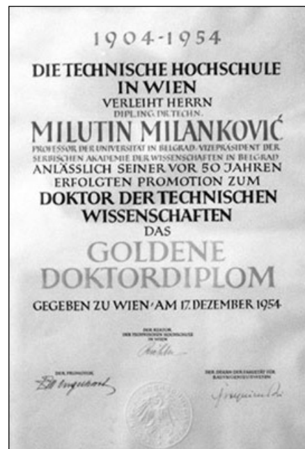
Докторска диплома Милутина Миланковића

ћу доносили лепе приходе, он је осећао да ће му живот бити испуњен жељеним задовољством једино ако се буде бавио науком. Понуду да постане професор на будућој Великој техничкој школи у Загребу није прихватио, јер су му у мислима стално били Београд и Београдски универзитет, који је, тајкорети, од свог оснивања (1905) настојао да ухвати корак са светским научним токовима. Ту је Миланковић видео изузетну прилику, јер је у то време већ био познат и признат стручњак, али и перспективни научник, тако да је једва дочекао телеграм којим га, у јуну 1909. године, обавештавају да је изабран за ванредног професора Београдског универзитета – на Катедри примењене математике, у склопу које су биле рационална и небеска механика, као и теоријска физика.