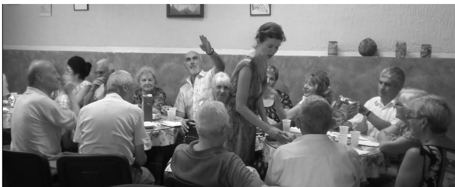
Старост се код свих људи не манифестује на исти начин

Позне године не доносе само ограничења, него и нове могућности