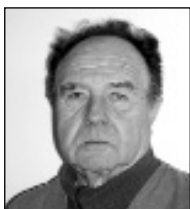
Уређује: мр сц. др Часлав Антић