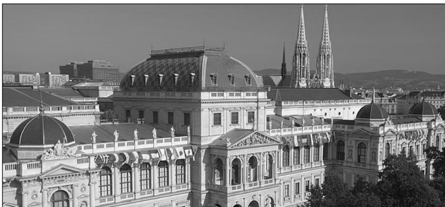
Техничка висока школа у Бечу – данас Технички универзитет