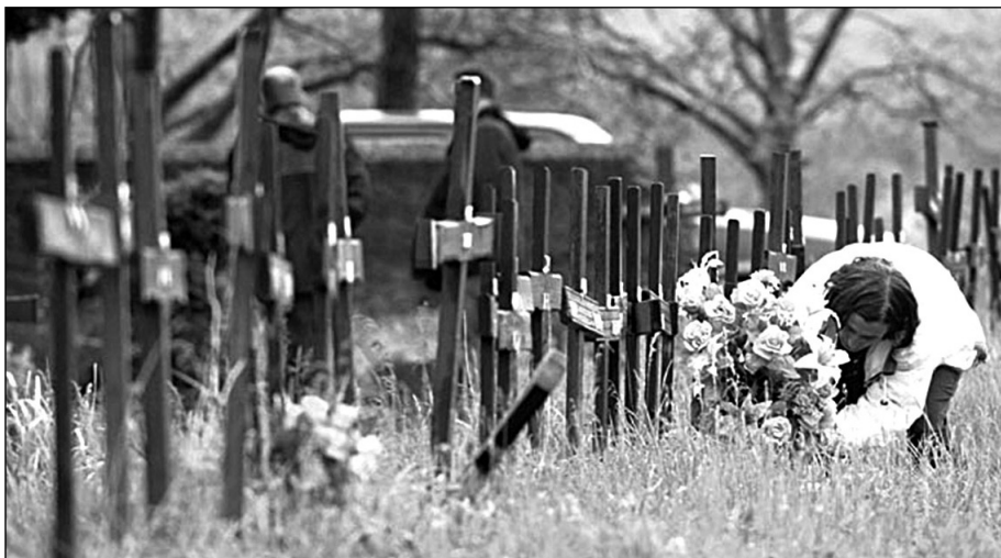
Книн априла 2000. пред почетак ексхумације: гробови Срба убијених 1995. године

Списак које је српско тужилаштво доставило Државном одвјетништву Републике Хрватске далеко је краћи – броји свега 51 име. – Постоје и спискови тајних служби