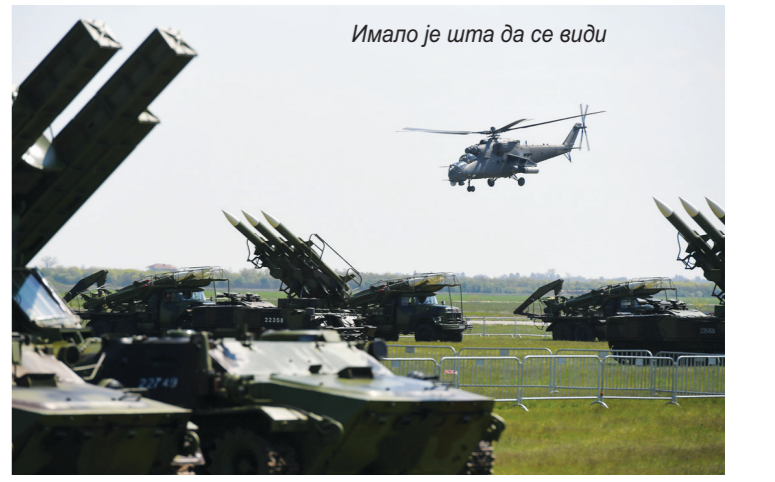
Имало је шта да се види

Посетиоци су могли да разгледају противваздухопловни ракетни системи „ФК-3“ и „Панцир“, противавионски самоходни артиљеријско-ракетни систем ПА-САРС, противоклопни ракетни системи „Корнет“, а и борбена оклопна возила „Милош“, „Лазар-3“ и „Хамер“, беспосадна возила „Мали Милош“, самоходну топ-хаубицу 155 мм НОРА, самоходни вишецевни лансер ракета „Огањ“ и савремена оптоелектронска средства.