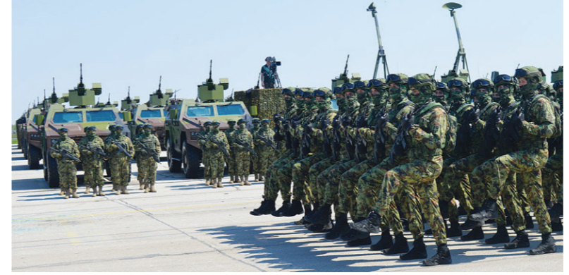
Монолитни строј специјалаца