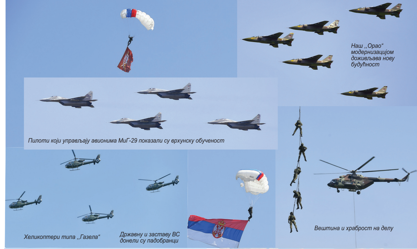
Пилоти који управљају авионима МиГ-29 показали су врхунску обученост

летелица „Врабац“ приликом недавног гађања на полигону погодила све циљеве. Први пут је приказан ракетни систем ПВО „Мистрал“ који је недавно испоручен из Француске. Ракете имају домет 7.500 метара изузетно су велике брзине – 930 метара у секунди. Учесници приказа били су наоружани модуларном пушком М-19, полуаутоматском и далекометном снајперском пушком, модернизованим пушкомитраљезом М-84, бацачем граната РБГ 40 мм/6 М11, терминалним нишанима ХТ-35 и рефлексним нишанима РС-С, комплетом заштите балистичке опреме Т-18 и Т-19. Специјалне јединице за специфичне задатке (ронилачка, падобранска и алпинистичка) снабдевене су посебном врстом опреме. У летачком делу програма, између осталог, наступили су авиони и хеликоптери „МиГ-29“, „Орао“, „Ласта“, „Ми-35“, „Х-145“ и „Ми-17“.