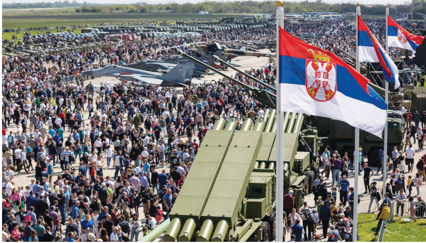
На Батајници, да види достигнућа наше војске, спило се више од 45.000 грађана