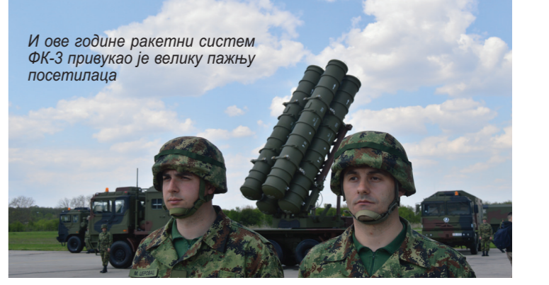
И ове године ракетни систем ФК-3 привукао је велику пажњу посетилаца