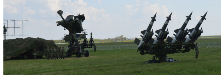
Модернизовани ракетни систем „Нева“