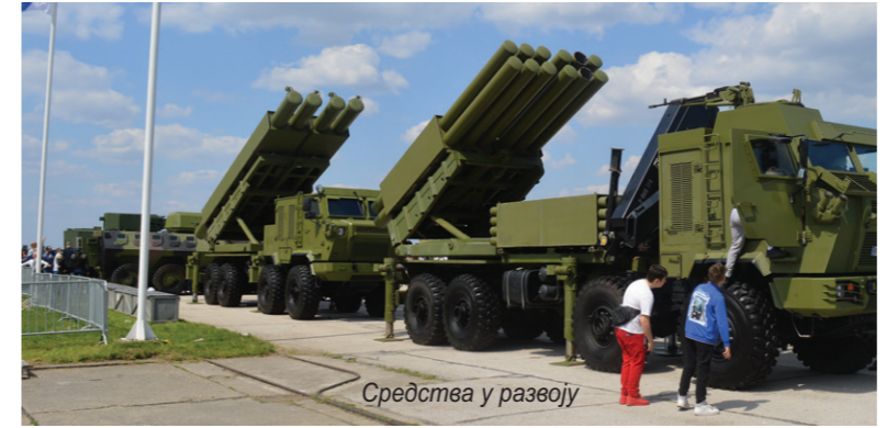
Средства у развоју