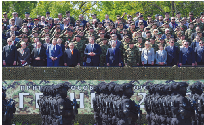
На свечаној трибини био је државни и војни врх Србије