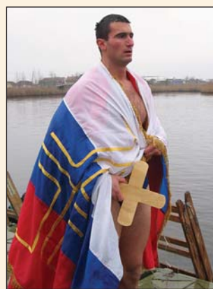
Пливању за Часни крст присуствовао је и Његова светост патријарх српски Иринеј

У традиционалном Богојављенском пливању за Часни крст, у више градова Србије, на Богојављење, ове године, такмичили су се и припадници Министарства одбране и Војске Србије.